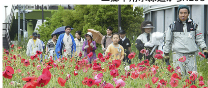
満開のポピーを見ながら