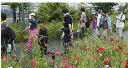
ちょっと雑草が多いか?