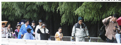
二郷半用水緑道からR298へ