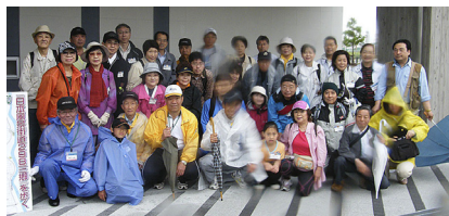
レンズに雨が・・・