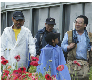
雨は降るが、話は進む