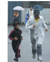
ゴールは近い 走れ!