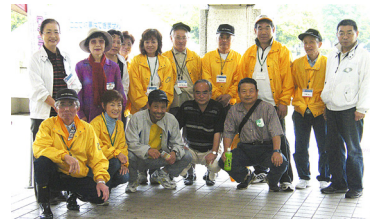
スタッフのみなさん ご苦労様でした