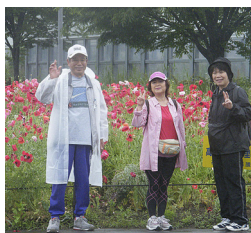
ポピーをバックに!