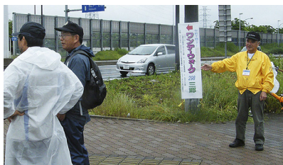
誘導するスタッフ