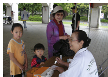
よく歩いたね。丸山先生との語り