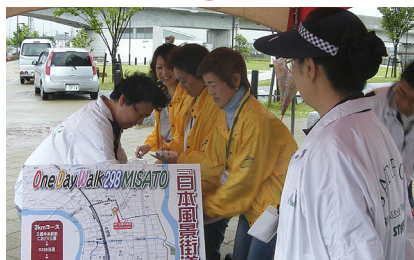
雨を気にしながらの受付

又、R298沿道には、見ごろとなったポピーは咲き、みさと公園では、今年からはじめた『芝桜』も楽しめました。同時開催の、フラワーフェスティバルは、残念ながら中止となりました。