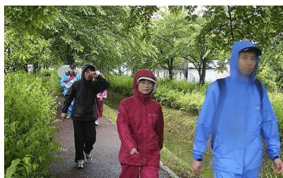
新緑の二郷半用水緑道