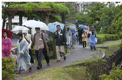
手入れが良い二郷半用水緑道